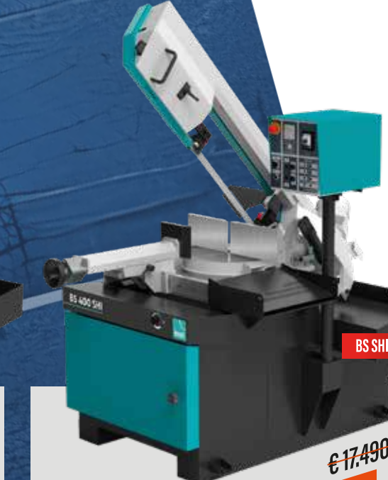
BS 400 SHI