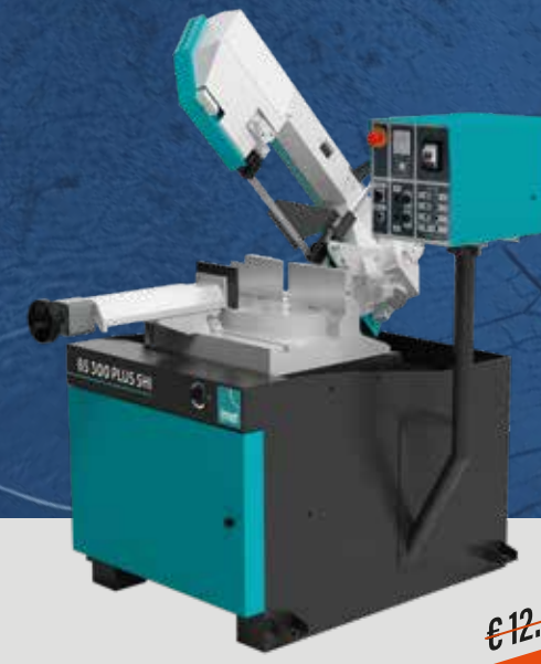
BS 300 PLUS SHI