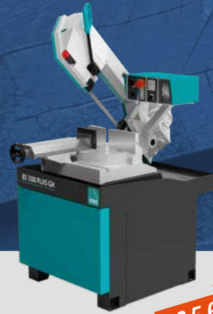
BS 300 PLUS BS 300 PLUS GH

€ 6.390 € 7.830 PROMO € 3.990 PROMO € 5.290