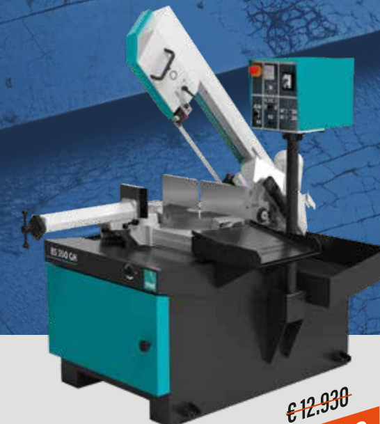
BS 350 GH

€ 8.390 € 9.590 PROMO € 5.690 PROMO € 6.390