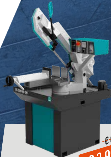
BS 300/60 BS 300/60 GH

QUALITÀ E AFFIDABILITÀ Un'ampia gamma di soluzioni di taglio per pieni in acciaio, putrelle e profilati di piccole e medie dimensioni