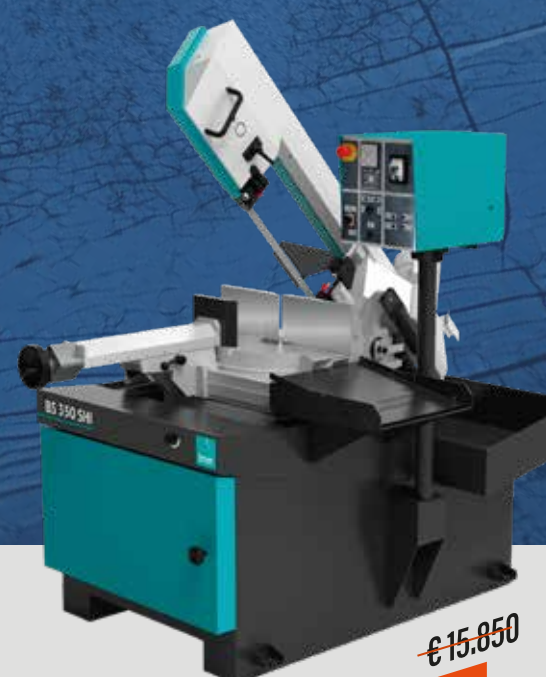
BS 350 SHI