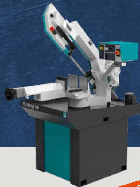
BS 300/60 SHI